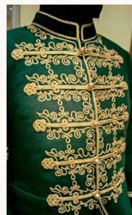
Magyar díszkocsis ruha