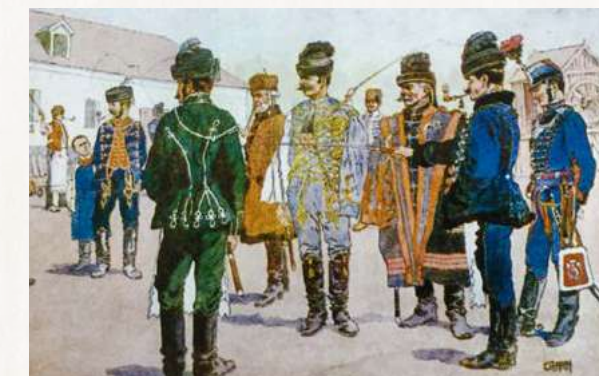
A magyar főúri családok kocsisruhái

A kocsis ülése a bakon olyan fontos, mint a huszár ülése a lovon. Felsőtuste függőlegesen egyenes legyen. A test