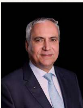
Ingmar De Vos a Nemzetközi Lovassport Szövetség elnöke

Szeretném megragadni az alkalmat, hogy köszönetet mondjak a szervezőbizottság és a partnereink az erőfeszítéseikért, akik lehetővé tették, hogy az esemény megvalósuljon, és tovább népszerűsítse a sportágunkat. Köszönet emellett az önkénteseknek és a szponzoroknak, valamint a versenyzőknek, kísérőiknek, a lelkes közönségnek és a média képviselőinek; köszönöm mindenkinek az elkötelezettséget és hűséget. Ez az esemény nem jöhetett volna létre Önök nélkül!