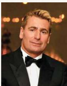
Lázár Vilmos a Magyar Lovas Szövetség elnöke tizenkétszeres fogathajtó világbajnok